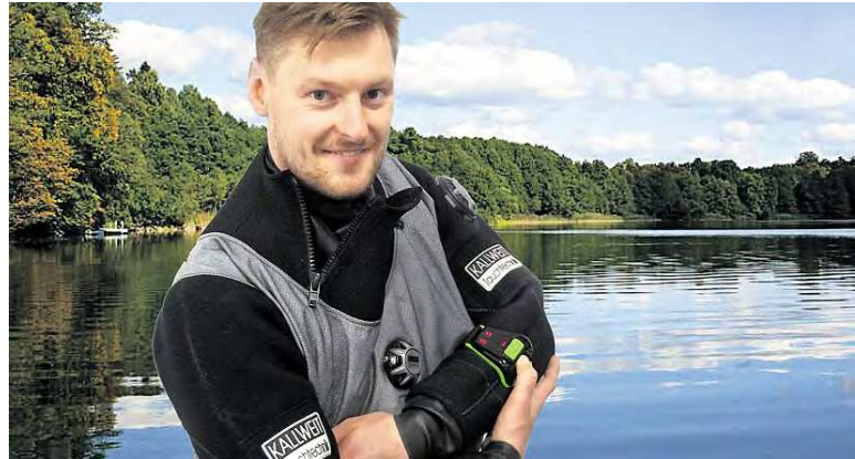
Der Buddy Watcher von Free Linked am Handgelenk warnt Taucher rechtzeitig, bevor die Tauchkameraden unter Wasser den Anschluss verlieren könnten.